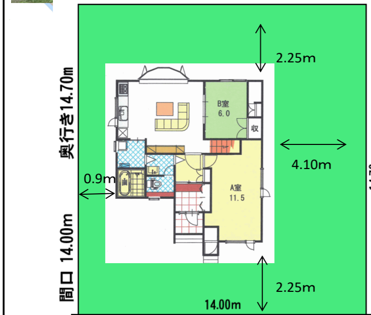
前面道路幅員 8.0m(市道)