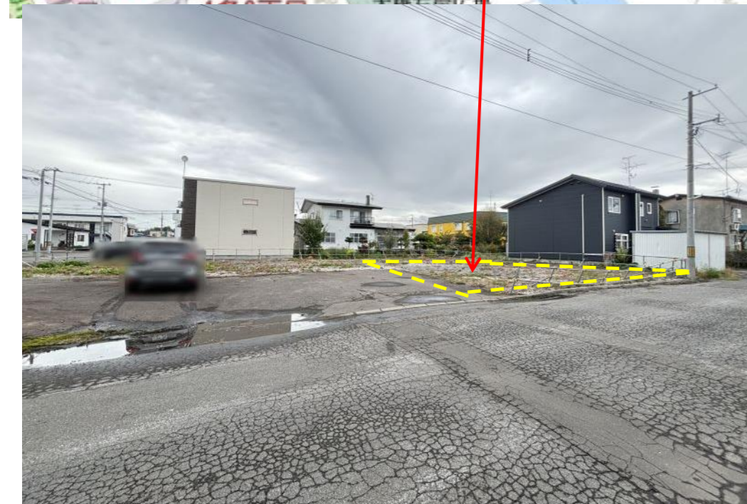
※ 図面は現況優先となります