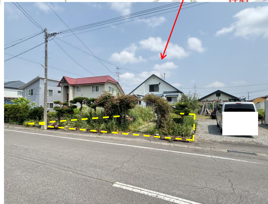
※図面は現況優先となります