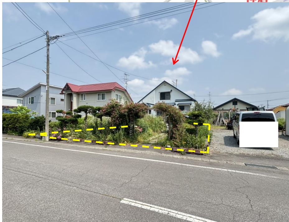
※図面は現況優先となります